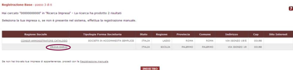
Figura 5 - Selezione la tua impresa

Per andare avanti, clicca sulla "Ragione Sociale". In questo caso, il sistema restituisce le informazioni anagrafiche e di contatto dell'impresa già presenti a sistema.