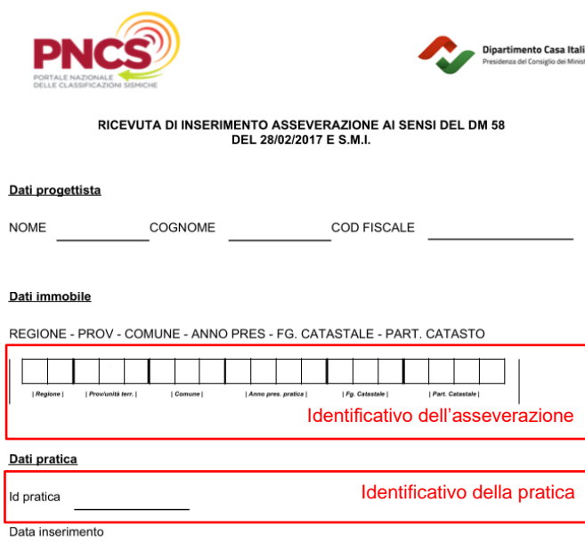
Figura 1 Dati identificativi contenuti nella ricevuta dell'allegato B

L'asseverazione si intende trasmessa dal professionista nel momento in cui lo stesso carica sul PNCS l'asseverazione firmata digitalmente (stato dell'asseverazione sul portale: "firmata"). Ai fini del rispetto dei termini perentori stabiliti all'articolo 6 comma 2 del presente decreto, fa fede la data di inserimento ("data inserimento") riportata nella "ricevuta di inserimento asseverazione ai sensi del D.M. 58 del 28/02/2017 e s.m.i.", rilasciata dal PNCS (si veda la figura 1). La medesima ricevuta viene conservata all'interno del PNCS a garanzia dell'unicità della trasmissione effettuata.