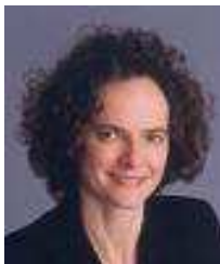
Nora D. VOLKOW

Professor of Neurology and Physiology University of California